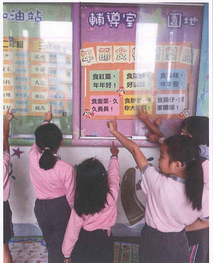
說明： 小朋友學習年節好兆頭用語，不僅有趣又有意思，獲益良多。