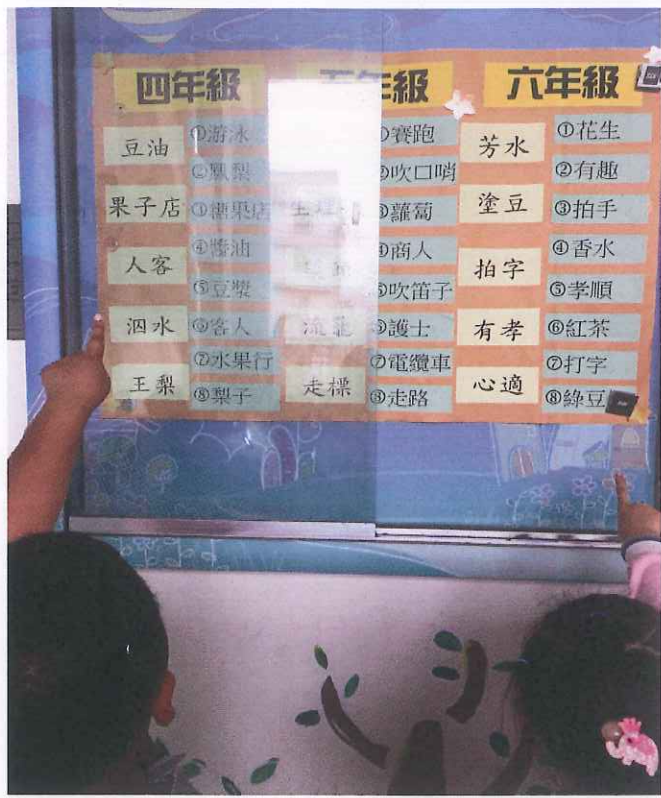
說明： 中年級小朋友，利用下課之餘學習日常生活閩南語情形。