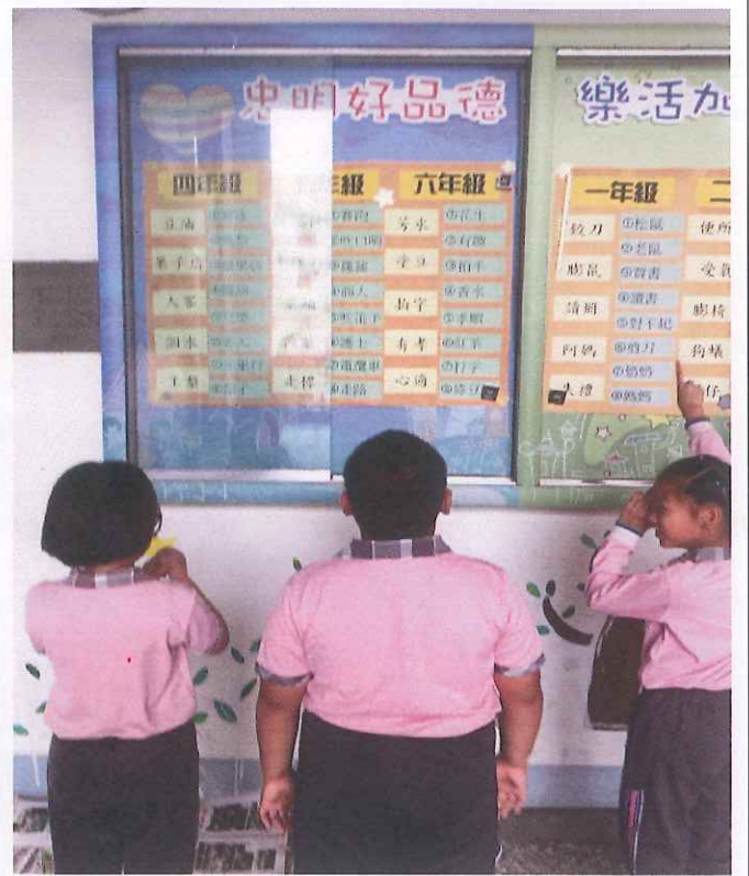
說明： 中年級小朋友，對照課本所學日常生活閩南語，「感覺足趣味」。